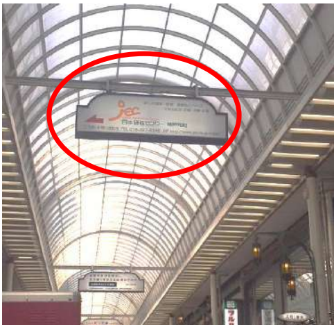
⑫アーケードの上の当会議室の看板が目印です！