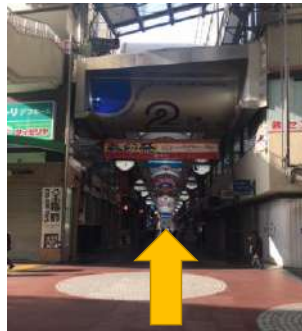
⑦センター街の端まで直進します。