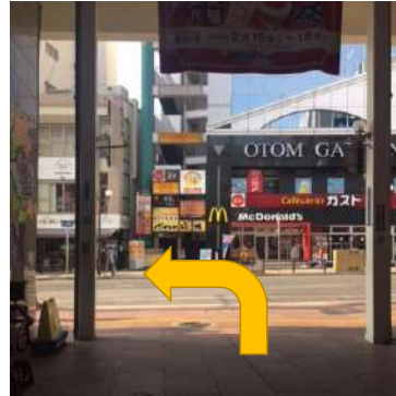
⑨端まで出れば左へ曲がります。