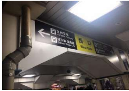
②JR三ノ宮駅西口を出た場合は左へ曲がります。