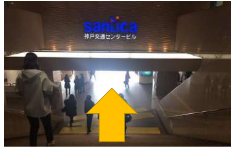
③直進し、階段を下ります。