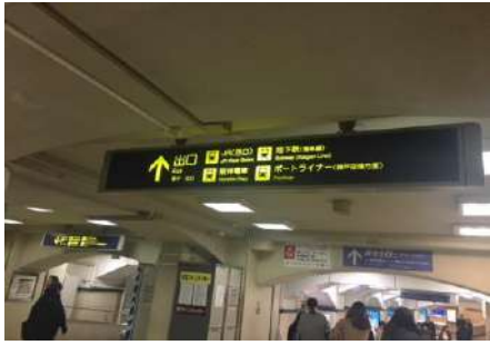
①阪急の神戸三宮駅東口を出て右へ曲がります。