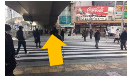
④横断歩道を渡ります。