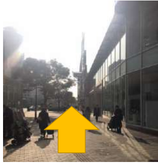
⑤そのまま直進します。