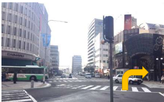
⑩大丸前のスクランブル交差点を渡り、元町商店街へ入ります。