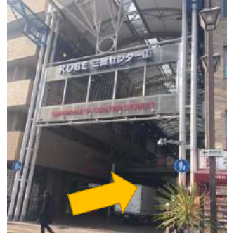
⑥右へ曲がり、三宮センター街へ入り、直進します。